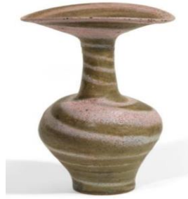
الشكل (5) ، للخزاف ( Lucie Rie )

الشكل (4) يمثل خطوات تجهيز الطين الملون قبل بناء العمل الفني الذي يتم بإحدى الطريقتين: " اما الترخيم بالتشكيل بالدولاب: يقوم الخزاف فيها بأعداد الطين ثم ضغطها دون مزجها ويقوم بعملية تشكيلها وبذلك تسحب الأظيان من القاعدة مارة بمحيط الشكل الدائري وتعطي المظهر الحلزوني للخطوط والمساحات بحسب عدد لون الأظيان المستخدمة ، او الترخيم بالتشكيل اليدوي : تعتمد هذه الطريقة على توحيد أو دمج مجموعة من الأظيان المختلفة الألوان، ومن المستحسن وضع أكثر من طبقة لكل لون ودمجها والضغط عليها بهدف أحداث تدخلات تشبه الرخام" (1) الشكل (5)