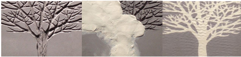
الشكل (1) يمثل خطوات تقنية التطعيم بالأطيان الملونة

ان اسلوب التطعيم من الاساليب القديمة التي استخدمها الانسان في السابق لأبراز بعض التفاصيل المراد تمييزها عن غيرها ( فهو اسلوب عرف في الحضارات القديمة واهمها مصر القديمة والحضارة الاسلامية فقد كانوا يستخدمون تطعيم الاحجار الكريمة في التماثيل المصنوعة مثل وضع احجار ثمينة في اعين الموميئات ) (1) اذ ان فن التطعيم كان شائعاً ويستخدم ايضا في صناعة الاثاث قبل ان يتم توظيفه في الخزف وقد بلغ " درجة متفوقة خلال القرنين الثالث والرابع عشر في سوريا ومصر أيام حكم المماليك ، كما كان منتشرًا في الاندلس والمغرب .. وفي اسبانيا ايضا " (2) ومن الجدير بالذكر ان الفنان الخزاف وظف هذه التقنية في عمله الخزفي واطهر جمالية لاقت قبولا واسعا اذ ان تقنية تطعيم الاطيان الملونة تظهر ابداع الفنان واسلوبه الخاص فهو يبدأ قبل جفاف الطينة ( في مرحلة تجلد الطين وذلك باحداث شقوق او حروز على السطح الطيني للعمل بالشكل الذي يفضله الفنان او شكل زخرفي بحيث تكون الحروز غائرة الى نصف الجدار تقريبا وبعدها تملأ تلك الحروز بالطين الملون ومن المستحسن ان يكون نفس قوام الجسم الطيني(3) الشكل ( 1 ) يوضح خطوات التطعيم الملون حيث استخدم الخزاف الطين الابيض في ملئ الحروز او الزخرفة مشكلا بذلك لوحة فنية ابرز فيها ابداع وجمالية تتم عن وعي الفنان ومستوى عال من الذوق الفني . وتوجد طرق عديدة في التطعيم والتي تعتمد بالدرجة الاولى على الفنان في اختياره الانسب للعمل الخزفي ومنها ( التطعيم المباشر او الترصيص بأستخدام القالب ) (4)