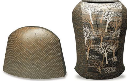
الشكل (2) الفنان (Moriyoshi SAEKI)

فطريقة الترصيص باستخدام القالب لاتحتاج الى حفر ارضية سطح الطينة وانما بطرق مختلفة الشكل ( 2 ) ويتم عن طريق ترصيص قطع طينية ملونة بأحجام مختلفة بجوار بعضها البعض وتوضع في قالب جبسي 1 وتتم هذه العملية بالجمع ما بين اللون وتقنية التشكيل بالحبال باستخدام قالب غير تقليدي حيث يتم تلوين الحبال الطينية الملونة وتشكيلها في القالب بالضغط كما موضح في الشكل ( 3 ) الذي يظهر طريقة توزيع الطينات الملونة بشكل جمالي غير مألوف باستخدام قالب حيث قام الفنان بتوزيع الاشكال الحلزونية والدائرية في وحدة مترابطة بالوان متناسقة ادت الى تكوين وحدة جمالية مبتكر (2)