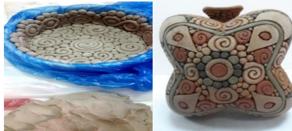
الشكل (3) تقنية التطعيم بالأطيان الملونة

فطريقة الترصيص باستخدام القالب لاتحتاج الى حفر ارضية سطح الطينة وانما بطرق مختلفة الشكل ( 2 ) ويتم عن طريق ترصيص قطع طينية ملونة بأحجام مختلفة بجوار بعضها البعض وتوضع في قالب جبسي 1 وتتم هذه العملية بالجمع ما بين اللون وتقنية التشكيل بالحبال باستخدام قالب غير تقليدي حيث يتم تلوين الحبال الطينية الملونة وتشكيلها في القالب بالضغط كما موضح في الشكل ( 3 ) الذي يظهر طريقة توزيع الطينات الملونة بشكل جمالي غير مألوف باستخدام قالب حيث قام الفنان بتوزيع الاشكال الحلزونية والدائرية في وحدة مترابطة بالوان متناسقة ادت الى تكوين وحدة جمالية مبتكر (2)