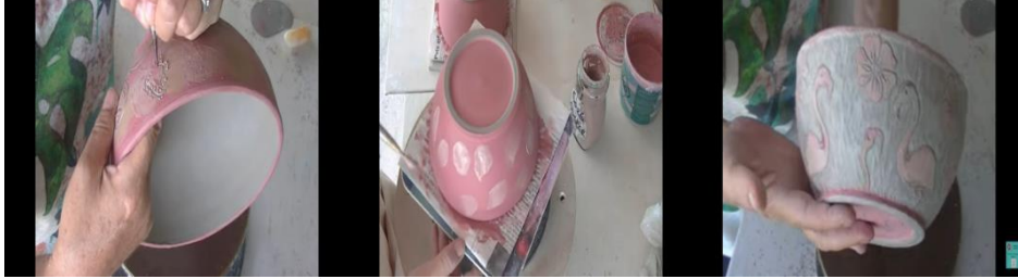
الشكل (9) يوضح خطوات السكرافيتو

وعليه فأنا نجد ان تقنية استخدام الأظيان الملونة في العمل الخزفي المعاصر يعد تحول في المفهوم السائد عن الاظهار اللوني في الشكل الخزفي اذ أصبح اللون خامة تشكيلية في مرحلة البناء وفي نفس الوقت يشكل عنصر زخرفي لوني اذ ان الفنان استطاع بخبرته التراكمية ان يطوع الخامة بالطرق التقنية الى عمل ابداعي جمالي. مما سبق نلاحظ ان توظيف الاظيان الملونة من قبل الخزاف لأظهار سطح خزفي متعدد الالوان محققا بذلك بعد جمالي تعبيرى للسطح الخزفي .