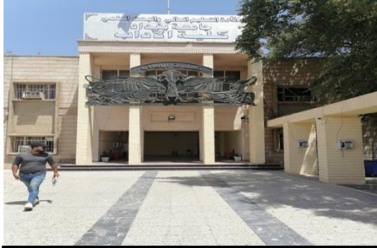
شكل رقم (3-1) يوضح واجهة المكتبة

متناغمة ومتناسقة ومنسجمة ، اذ نجد وحدة العلاقات التصميمية بين العناصر التي يدركها المستخدم وتفسيره الكامل في جوهره .