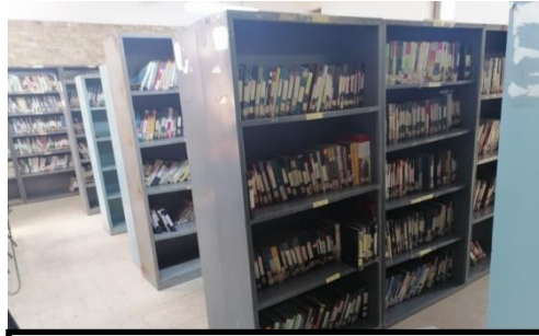
شكل رقم (4-3) يوضح طرق التنظيم في الفضاء

قاطع من الرف حرفا ابجديا يساعد الباحث في ايجاد ما يبحث عنه وبذلك حقق نظاما خطيا منسجما مع الوظيفة التصميمية التي تحقق الاتزان الرواقي والتي تتوافق من متطلبات الجسم البشري من