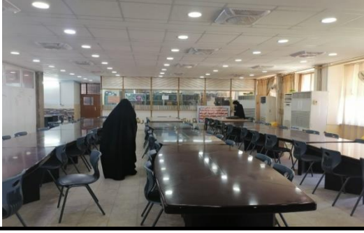
شكل رقم (3-6) يوضح الرسمية في التصميم

والطمأنينة وهو بذلك حقق التوازن ما بين البيئة الداخلية والبيئة الخارجية بشكل متوازن يحاكي الطبيعة في مفرداته التصميمية كما في الشكل رقم (3-5) كما تميز ملمس المواد المصنوعة منها الاثاث ومكملاته وكذلك العناصر الانشائية للفضاء الداخلي للمكتبات بتنوعاته المختلفة كل