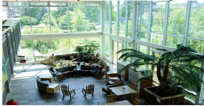
شكل رقم (2-2) يوضح التصميم اللاهوتي من خلال الانسجام التصميمي وارتباطه بالطبيعة

اولا : اللاهوت الطبيعي :- يختص بدراسة الاله ووجوده وطبيعته ، ويحتوي كذلك على العديد من الموضوعات المتضمنة لطبيعة الدين وتصورات نشأة الكون ووجود المقدس والاسئلة الخاصة بالخلق وكل ما يخص الكيان الانساني بوجهه الانساني بشكل عام ويمكن ان نشير الى الانسجام في الكون اذ انه يرتبط بمفهوم نظام متكامل اذ انها تكون تصورات كاملة تمثل هذه الجوهر الاساسي لافكارهم وتصوراتهم (حسام الدين . 2011 . ص 18) اذ ان اهم ما تبحث عنه اللاهوتية هو البحث عن الانسجام والتوافق الكوني اذ ان التصميم يسعى بشكل اساسي الى تكوين القدرة على الاحساس بالجمال والتناسق والتوازن في العملية التصميمية كما في الشكل رقم (2-2)