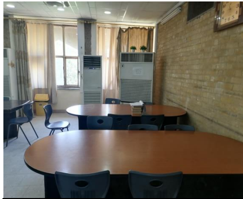
شكل رقم (5-3) يوضح طبيعة الالوان في التصميم

تصميمها اذ ان وحدات القراءة (منضدة) كانت بالوان حيث اعطى الاحساس بالترابط مع الطبيعة والشعور