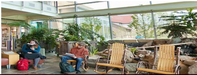
شكل رقم (2-3) تعزيز العلاقة بين الداخل والخارج في فضاءات الاستراحة وارتباطها بالمكتبة

1- الطبيعة:- ان بحث علم الوجود الرواقي قد يكون مثمرا اذ ما بدأ عند فقرة من محاور الفسطائين لافلاطون ، اذ يطلب افلاطون علامة او اشارة لما هو كائن او ما له وجود احدى الاجابات التي تم تقديمها ، اذ ان القدرة على الفعل او الانفعال هي العلاقة المميزة للوجود الحقيقي اي ما هو الكائن ، يقبل الرواقيون هذه المعيار ، وهذا مما يعطي الانطباع بان الرواقيين ماديون او بنحو ادق باعتبار فهمهم للمادة كمبدأ منفعل ، على اي حال هم يقولون ايضا ان هناك طرقا اخرى للظهور في مجمل موجودات العالم ، باكثر مما تظهر بسبب الوجود ، وان الاشياء اللاجسمية مثل الزمان والمكان او المعبر عنه مثل الاشياء المتخيلة، وان الفاصل بين ما هو حي وما هو موجود يزيد الى حد ما ، من صعوبة استيعاب المادية الحديثة للمذهب الرواقي ، اذ ان هناك دورة لا نهائية للتكرار ومن بين اربعة عناصر تحدد الطبيعة الرواقية اثنين كعنصرين فاعلين (النار والهواء ) وعنصرين منفعلين (الماء والتراب ) يندمج العنصران الفاعلان لتشكيل علة الاستدامة ربما جاء ذلك استلهاما لحالات التمدد والانكماش الناتج عن الحرارة والبرودة (Dufour, Richard 2004. p3) وبمعنى اخر ان الطبيعة الرواقية تبحث وبشكل اساسي على ما يحتويه الكون من مؤثرات تؤثر على التصميم بشكل عام وعلى الانسان بشكل خاص من خلال عنصري الفاعل والمنفعل كما في الشكل رقم (2-3)