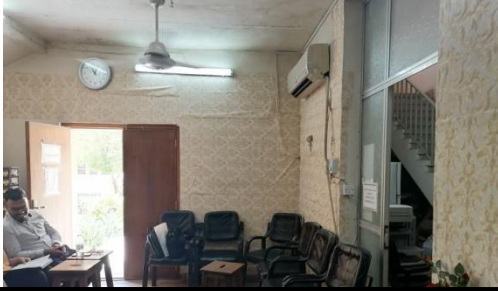
شكل رقم (2-3) يوضح الهيئة التصميمية

2- لتحقيق الاتزان الوظيفي تحقق المنطق الرسمي في الفلسفة الرواقية ، وبذلك اضى انعكاس صفة المنطق الرسمي للفضاء الداخلي للوظيفة التصميمية كما في الشكل (2-3). وكذلك نجد ان الفضاء يختلف في طبيعة حجمه في الهيئة التصميمية . وبشكل عام فان طبيعة الفضاء لا تناسب الوظيفة المطلوبة او الوظيفة المحققة في الفضاء الداخلي وفق المنطق التصميمي اذ كانت ذات حجم غير مناسب من الناحية التصميمية التي لا تتوافق مع الهدف التصميمي الذي كان ذا تصميم يحقق