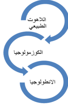
شكل رقم (1-2) يوضح فروع الميتافيزيقيا

الاعراض والصفات الذاتية لكل الجوهر وبذلك تعد الميتافيزيقيا علم الاصول الاولى والعلل والتبينات الاولى والنهائية في الوقت ذاته علما بالوجود بما هو موجود (مهدي قوام . 2019 . ص 20-24) ، اذ تدور الميتافيزيقية خلال ثلاثة محاور كما في المخطط رقم (1-2)