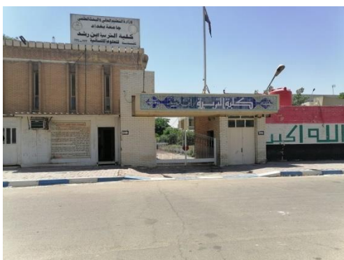
شكل رقم (1-3) يوضح كلية ابن رشد - موقع المكتبة

ووحدات القراءة (الطاولات ) من مادة البلاستيك بلون بني غامق في حين كانت وحدات الخزن من الخشب والزجاج ، اما الاضاءة فكانت اضاءة سقوية بلون ابيض