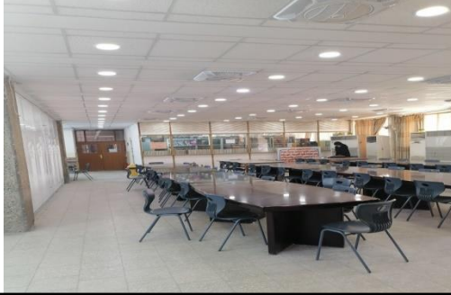
شكل رقم (2-3) يوضح طبيعة الهيئة

تحليل العينة الاولى:- 1- اسلوب البساطة والتعقيد، المنطق وانواعه في التصميم الداخلي :- تميزت هيئة الفضاء الداخلي للمكتبات بالاستطالة في طبيعة هيئته التصميمية حيث منحها المرونة والانسيابية في الحركة والاداء الوظيفي للنزعة المادية الرواقية حيث ان المعاني الكامنه في التنظيم الفضائي نشأت بفعل القواعد التصميمية المتوافقة مع الوظيفة التصميمية من حيث التوازن بين مفرداته التي كانت من جزئيات التصميم التي دعت الية مبادئ الفلسفة الرواقية ، اذ ان الشكل المستطيل ومن جزئياته (المربع) ماهي الا كمعالجات للبيئة ذات المناخ الحار وفق نظام التضام ، مما اعطى انعكاس الرقي للفضاء وبذلك قلل من الاضطرابات الانسان التي سعت الى الحفاظ عليها في الفلسفة الرواقية والحافظ على التوازن الداخلي للانسان الذي يبعث الراحة النفسية لمستخدم الفضاء الداخلي وبذلك تكوين تصميم رواقى يحقق الوظيفة الادائية في فضاء المكتبة كما في الشكل (2-3)