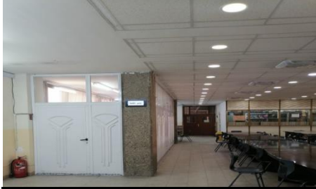
شكل رقم (3-3) يوضح ضعف الرمز في التصميم

لدى المستخدم من خلال استخدام الاسلوب التجريدي وفق مبدأ النسبة والتماثل والانسجام في التصميم حيث كانت خالية من الرموز والنقوش والزخارف والعناصر التزيينية مما ولد ضعفا في انعكاس جمالي لدى المتلقي والمستخدم كما في الشكل رقم (3-3)