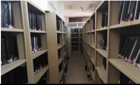
شكل رقم (3-3) يوضح طبيعة الحركة

نوعا من الاضطرابات الداخلية للانسان من خلال عدم الراحة فيه بالنسبة لحجم الفضاء والوظائف المطلوبة للفضاء الداخلي للمكتبة وبذلك فان الحجم حقق نزعا من الاضطراب الداخلية للانسان التي تؤثر على الانسان في تحقيق الاداء الوظيفي وبالتالي يقلل من تحقيق الوظيفة في التصميم الداخلي حيث ينعدم الاتزان الداخلي للانسان من خلال هيكله التصميمي وباعداد وقياسات لا تناسب حركة المستخدم داخل الفضاء وبذلك يفقد التصميم التوازن الداخلي ويعيق الحركة والارباك في الاداء الوظيفي كما في الشكل رقم (3-3).