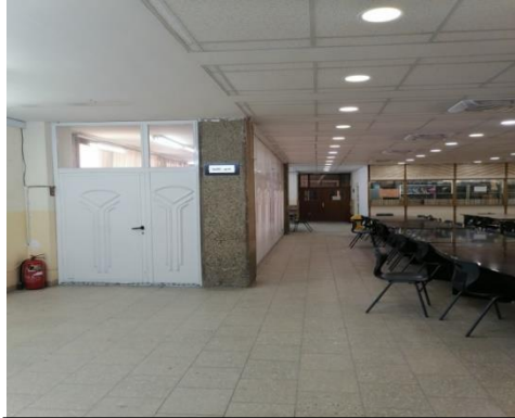
شكل رقم (2-3) يوضح طبيعة التنظيم

كذلك نجد ان الهيئات و الاشكال البسيطة في حجومها وابعادها المتناسقة وتناغمها بين مستوياتها المختلفة من حيث الحجم والهيئة مع الفضاء ككل بابعاد تناسب قياسات جسم الانسان المختلفة مما منح الفضاء المنطق الرواقى المحقق للوظيفة التصميمية التي تتناسب من حجم الفضاء من الناحية الوظيفية والجمالية .