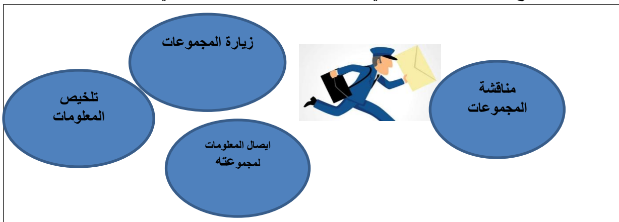
الشكل ( 1 ) مهامات المراسل المتنقل في الدرس " من اعداد الباحث "