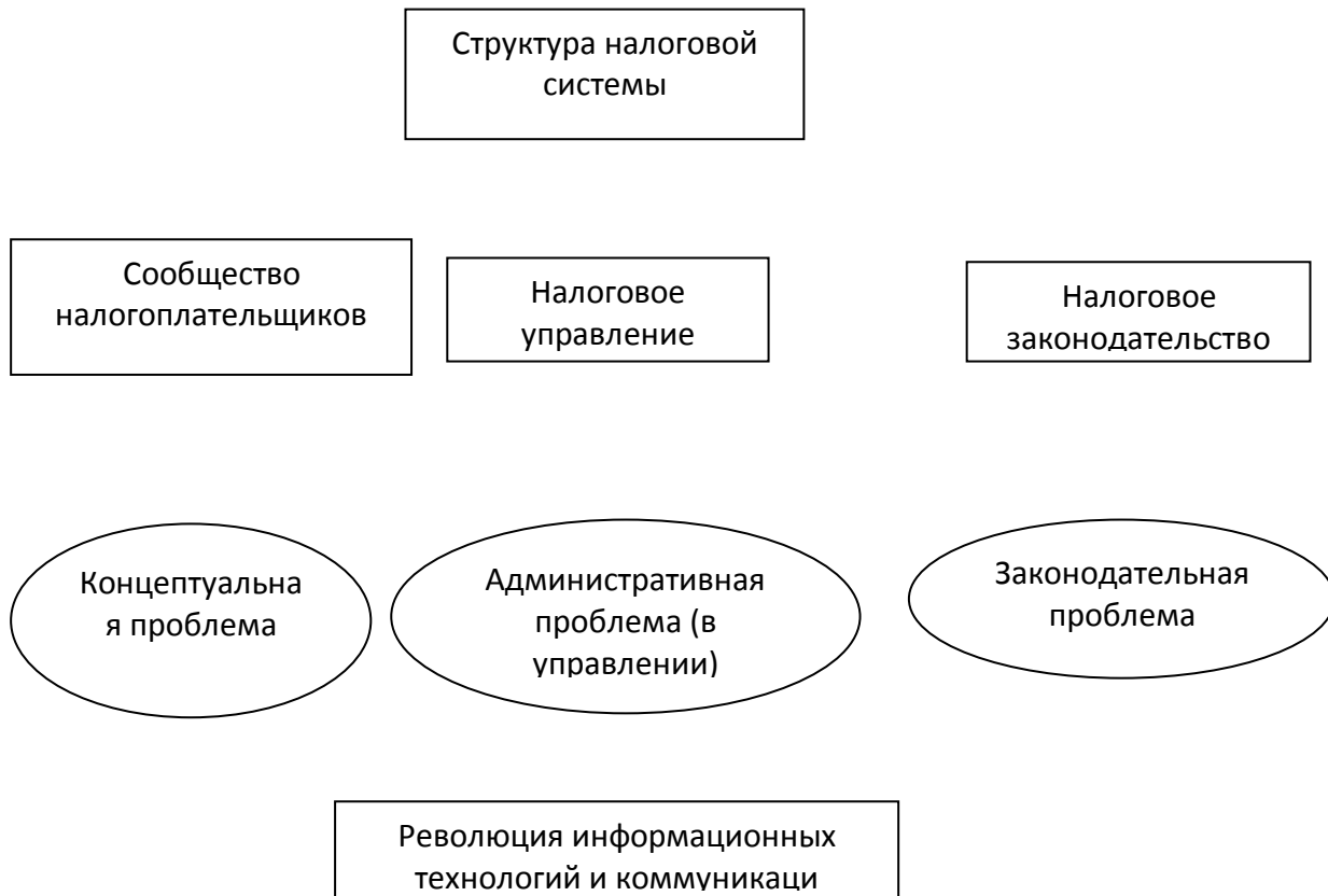
Рисунок 1. Взаимосвязь между структурой налоговой системы и применением в ней информационных технологий

Налоговое законодательство, формирование которого происходило под воздействием традиционных деловых контактов, сталкивается со сложностями в применении к области электронной торговли, иными словами, в данной сфере существует «законодательный пробел». Несмотря на постоянные заявления о проведении реформирования, существуют недочеты в господствующих законодательных системах, в принимаемых поправках и разработках нового законодательства касательно электронной торговли.