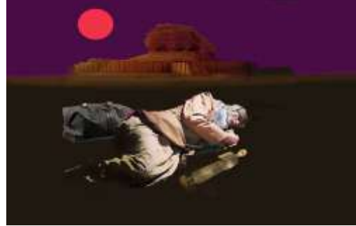
الشكل (3) العراقي الأخير. زيت على قماش. 100×80سم. 2015م.