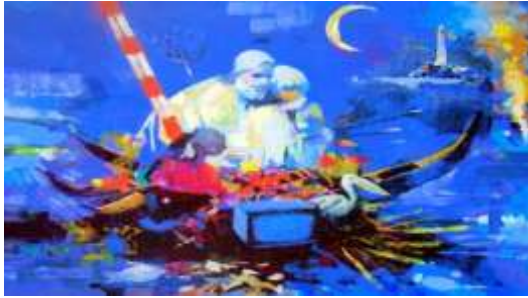
الشكل (6) عودة للهوور اكريلك 2006 80×100