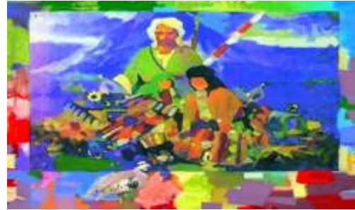
الشكل (5) اغنية الفجج اكريلك 80×100 سم 2006.

كما إن أسلوبه في جلّ أعماله اقترب من عملية التصيق (الكولاج) كما في الشكل (3). من خلال هذا برز الفنان جبار بأسلوبه الذي تميز به عن طريق تجاربه المتنوعة في مجال إبداعه هذا. فالشخصيات الفنية المتميزة التي أصبحت ذات كفاية بالعمل كونت وجربت مرات عدة في وسط العمل نفسه وتبينت عن الطبيعة مباشرة دون وساطة بأشياء وعدد حقيقية وبعمليات ممارسات فعلية لتلك الأشياء. وبمعرفة وكيفية استعمالها وضرورتها. هذه جزء من مسيرة الفنان العراقي المحترف الأول سلام جبار جبار الأشكال (4،5،6).