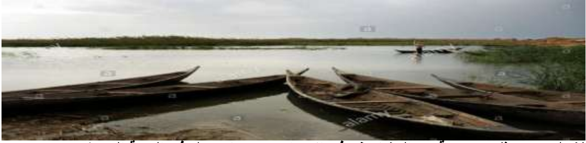
الشكل (2) يمثل مجموعة من المشاحيف في الأهوار مع صياد سمك في الجهة البعيدة.

خاصة يلاحظ الألفة والتعاون التام بينهم من أجل انجاز عمل ما كإنشاء منزل لفرد معين، أو في حالة الكوارث الطبيعية كالفيضان والحرائق. أما الخاص فيتعلق بنشاطات الفرد العديدة التي يحاول بها التغلب على المؤثرات البيئية لكيلا تسبب له مازقاً أو يحاول توظيف عناصرها لخدمته. وللبيئة أنواع وخصائص عدة كالبيئة السهلية والجبليّة والصحراوية وبيئة الأهوار (الأراضي الرطبة) الشكل (2) والبيئة الاجتماعية والبيئة الجوية المتغيرة (صليبا، 1982، ص220-221).