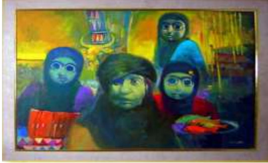
الشكل (4) بناء عشتر 2007 زيت على الكنفاس المصدر: أرشيف الفنان.

التي أنجزها هي: اللون الأبيض ولأحمر والأخضر والأزرق والأصفر التي تميز بها لإنتاج منجزاته الفنية فضلاً إلى إنها نمت وجود الأشكال العديدة بتفصيلاتها الواقعية والرمزية على سطح اللوحة المرسومة التي احالة مواضيعه إلى عالم تاريخي قديم بسحنة بيئية محلية. أتضح من خلال تأكيده في إنشاء مواضيعه باللون الأبيض والأزرق والأصفر ولأحمر وغالباً المركبة التي يطغي عليها صفة ضبابية دالة على معاناته المؤلمة التي أثرت في وطنه الأم (العراق).