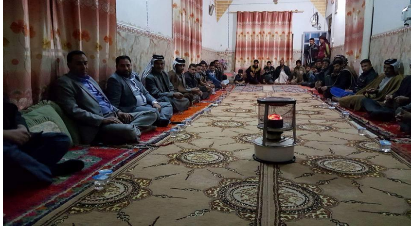
صورة رقم (1) توضح الجلسة العربية المسماة (التربية)

يمكن في أوضاع مختلفة مدة ساعات، أي أن كل جزئية من جزئيات رأس عظمة الفخذ تلامس كل جزئية من جزئيات الفقرة. كما مبين في الصورة رقم (1)