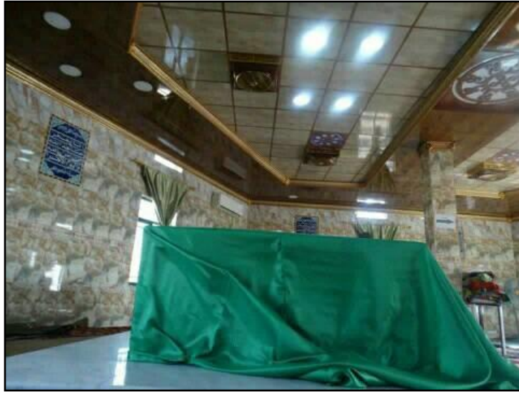
مرقد بنات الحسن عليهما السلام