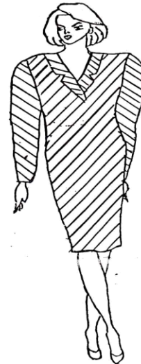
نموذج رقم (٤)