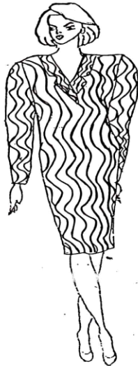
نموذج رقم (٥)