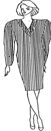
نموذج رقم (١)