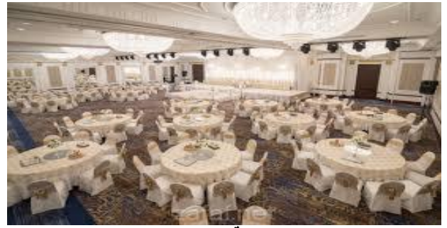
alsgure.web.app العينة (1)