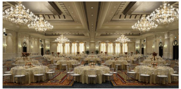
emirates.zafaf.net العينة (5)