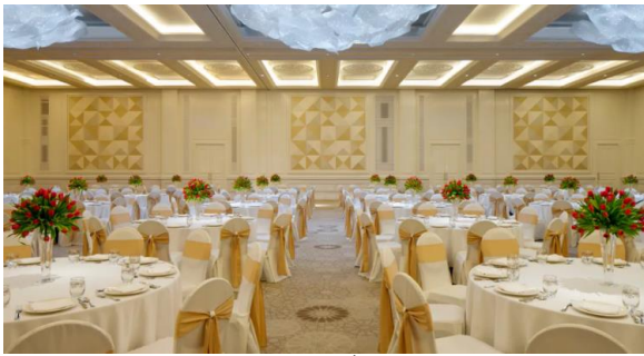
emirates.zafaf.net العينة (4)