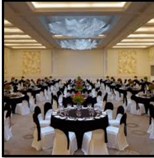
Figure 6: The second form of the sample

3-8-2 الانموذج الثاني :-الفضاء الداخلي (قاعة روما للمناسبات في منتجع ريتز كارلتون في ابوظبي)