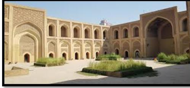
Figure 1: Represents the expressive structure in the traditional decorations (AL-Mustansiriya School )

الشكل رقم (1) يوضح البنية التعبيرية في الزخارف التراثية (المدرسة المستنصرية) (5)