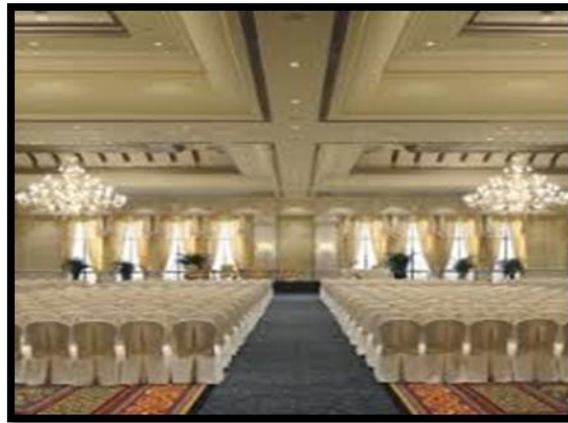
Figure 7: The second form of the sample

شكل رقم (7) يوضح الانموذج الثاني من العينة