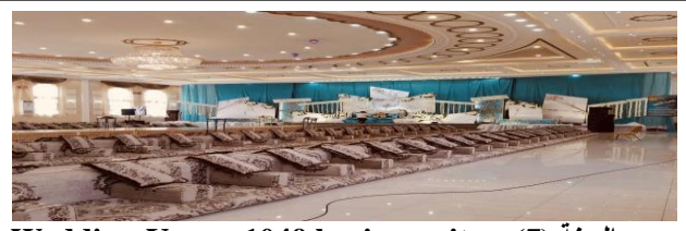
Wedding-Venue-1049.business.site العينة (7)