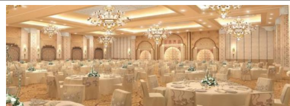
arabiaweddings.com العينة (8)