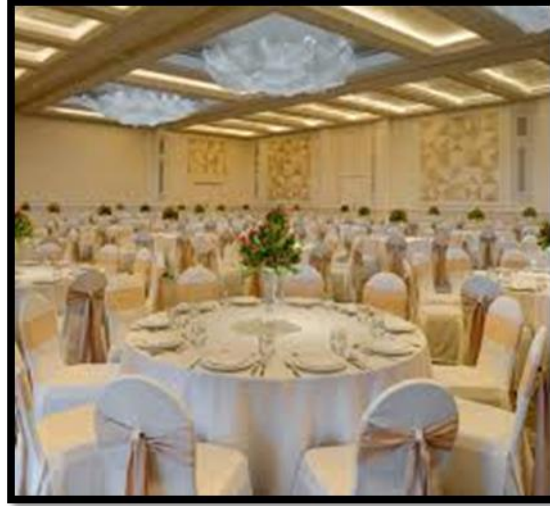
Figure 5: The first sample

شكل رقم ( 5 ) يوضح النموذج الاول من العينة