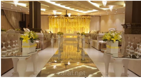
Saudi-arabia.zafaf.net العينة (2)