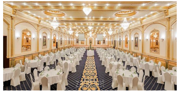
Saudi-arabia.zafaf.net العينة (3)