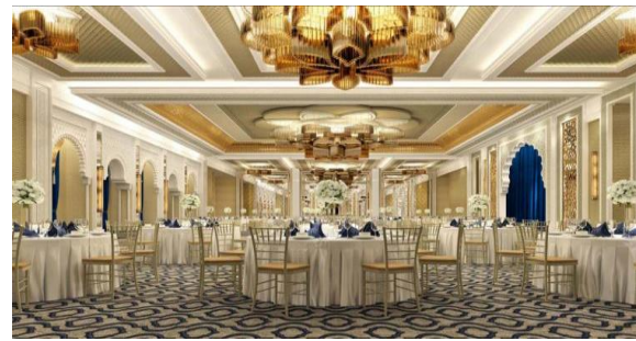
arabiaweddings.com العينة (6)