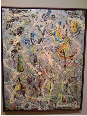
Galaxy, 1947, (oil, aluminum paint, and small gravel on canvas , 43 1/2 x 34 in. [110.4 x 86.3 cm]), Joslyn Art Museum, Omaha, Nebraska. Gift of Miss Peggy Guggenheim. OT 169

المذنب ، غالاكسي ، الانعكاس - الدب الأكبر ، والأهم من ذلك ، لوسيفر. التي تشبه بجمع علاقة بين الارض والسماء بفرش قماش اللوحة على الارض واسقاط اللون عليها . واحدة من هذه المجموعة لوحة (غالاكسي) التي تحوي على مواد غير متجانسة (heterogenous material) ، وهي تتناغم مع مجموعته ( قطع الموت death pieces) التي سبق ذكرها ، ولكن قدمها بعنوان آخر وبصورة شعرية مختلفة وأسقطها بتعقيد أكثر . المذنب (Galaxy) تبدو أكثر حرفية اذ اسقط الضوء بزواوية مائلة الى الاسفل . لاحظ الاشكال ادناه كيف تختلف شكل اللوحة والوانها باختلاف زاوية الضوء الساقط.