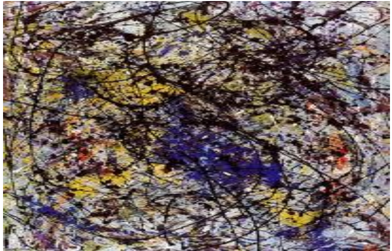
Big Dipper 1947

عمله الاخر الدب الأكبر هو أكثر غنى في اللون ، يمثل الى حد ما قراءة لصور النجوم ، فالغيوم في خلفيتها و أغصان الأشجار معكوسة في بركة امام اللوحة ، هذا العنوان يوضح كيفية توظيف اللوحة الأرضية لتصوير السماء ، هذا المنظور هو المتصور عند مشاهدة