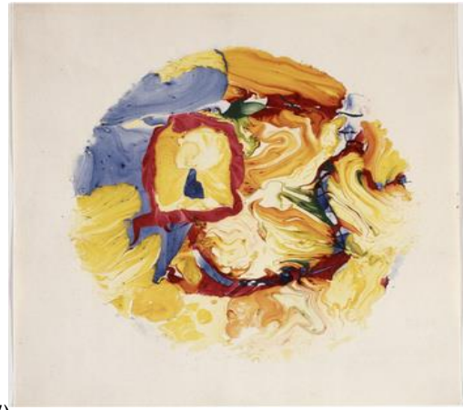
4- باين روكسي 1966, Roxy Paine (17) : واعماله نموذج عن اللوحة (التراكمية) (Pliage)