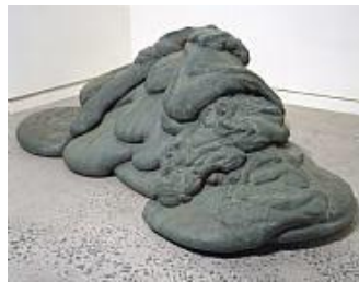
Eat Meat 1969-1975

2- رودني غراهام Rodney Graham 1949 :- وكما يظهر في الشكل فان أسلوب هذا الفنان