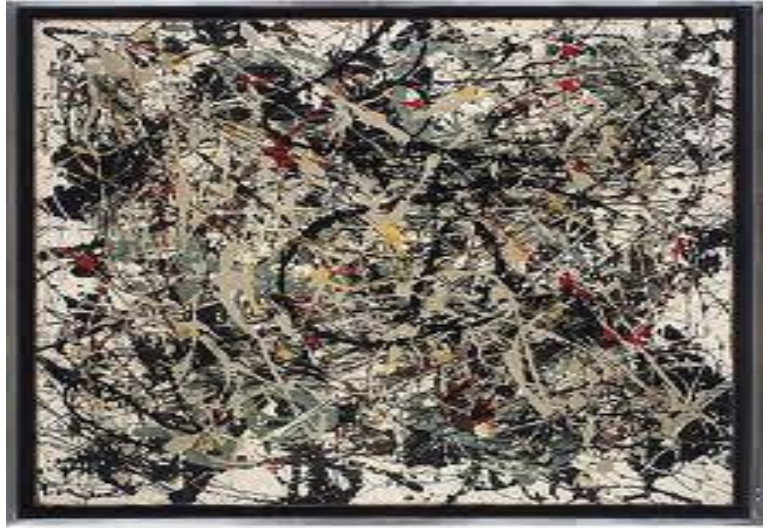
(العاصفة, death poem) (( 1947

(سقوط الاعصار الخامس) من اعمال بولوك المبكرة بالتقطير. الطبقات العليا من اللوحة تتكون من خطوط مضيئة متداخلة من الطلاء الأسود والفضي في حين تم تطبيق جزء كبير من قشرة الطلاء بواسطة الفرشاة والسكين على اللوحة، من نظرة مقربة كما في الشكل اعلاه و يمكن ملاحظة لتفاصيل هذا العمل نشاهد كمية واسعة من المخلفات مثل أعقاب السجائر، والنقود المعدنية، والمفاتيح تحت هذا الطلاء، مما ساهم في بناء سطح اللوحة واعطى كثافة باحساس متموج. اما العنوان هو اقتباس من مسرحية شكسبير العاصفة، حيث الالهة ارييل تطالب من ابيها باثوم بموت البحارة من قبل غرق السفينة: "... لتصنع من عظامهم لالى ومرجان لها .