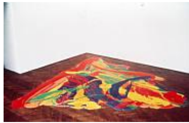
Bounce I 1969