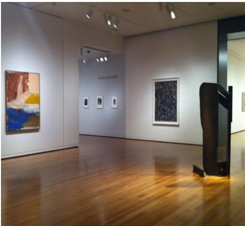
Sea Change تغيرات البحر 1947 120x90cm , Modern and Contemporary art galleries, متحف كارولاينا

رغم وجود رأيين نقديين في المجتمع الفني المعاصر، اتخذ بولوك الاتجاهين معا كنهج له الا ان منهجه اقرب الى روزنبرغ الذي يتصف بالسخرية وهو على العكس من منافسه غرينبرغ الذي اتصف بالجدية