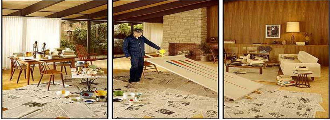
3- اندريه ثومكسن 1930 – 1985 (16)